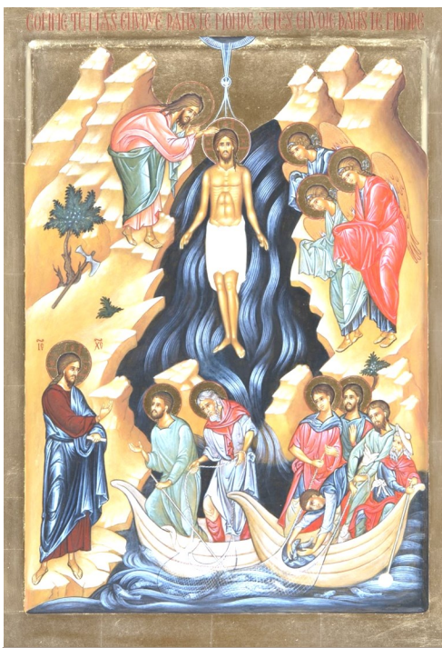
Icône du parcours Saint Marc « Entendre Celui qui m'appelle à être disciple ».

Prenons de la hauteur, mettons-nous sous le regard de Dieu pour relire cette année, pour se rendre compte de ce que le Seigneur a fait dans notre vie durant ces derniers mois. Dans la seconde lecture de ce dimanche, Saint Paul ne nous exhorte-t-il pas à reconnaître ce que Dieu a réellement changé dans notre vie ? Bien avant d'appartenir à tel