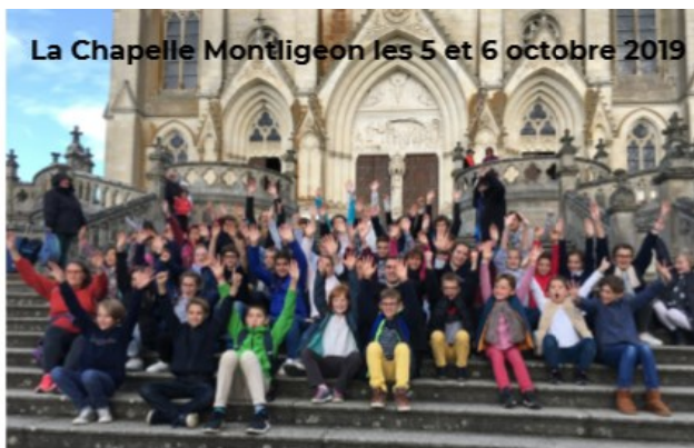
La Chapelle Montligeon les 5 et 6 octobre 2019