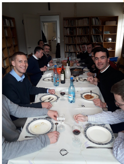
Une pause bien méritée !

Merci à vous tous pour le témoignage que vous leur avez rendu et gardons-les dans notre prière!